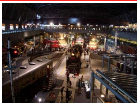
※本館 1F 車両ステーション