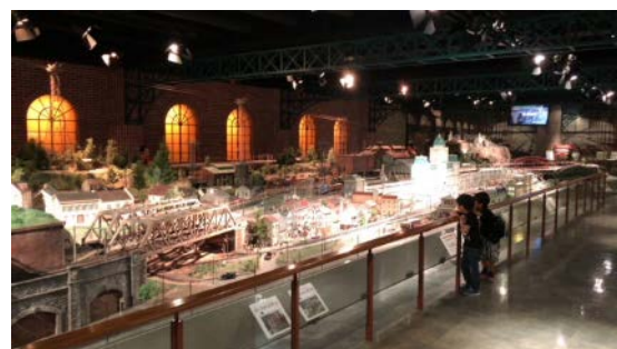
※世界最大級の一番ゲージジオラマ「いちばんテツモパーク」